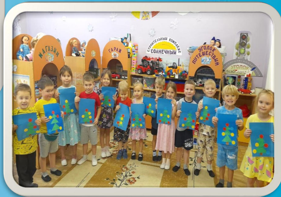
Изобразительная деятельность : аппликация «Ёлочка»