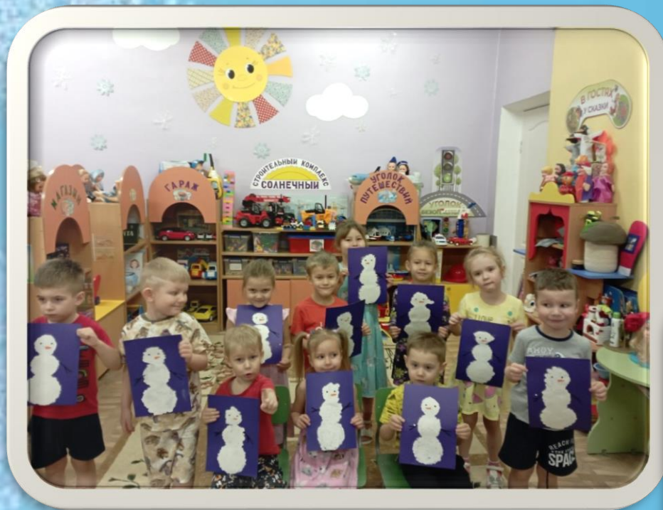
Изобразительная деятельность : рисование «Снеговик»