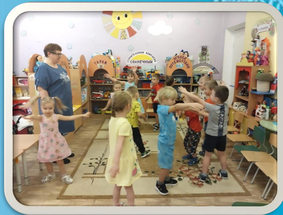
Коммуникативная игра «Льдинки, снежинки, сосульки»