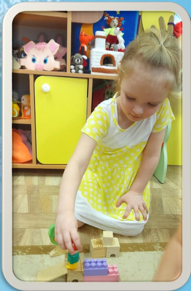
Конструктивная деятельность «Горка»