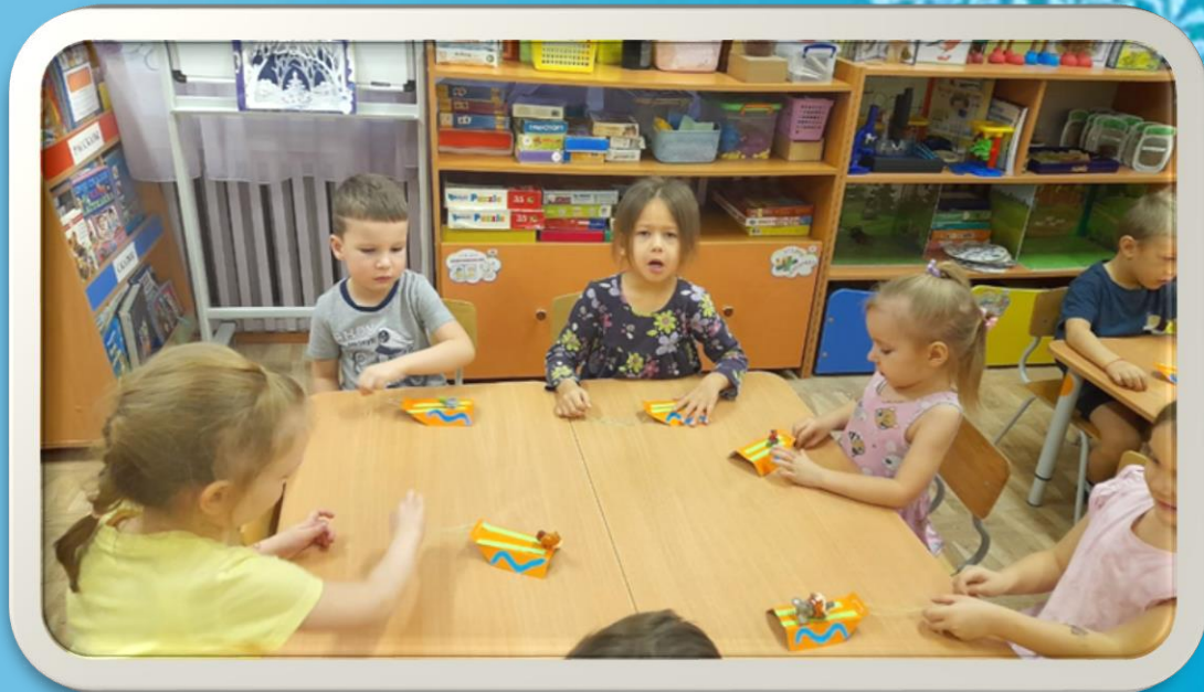
Конструктивная деятельность «Санки»