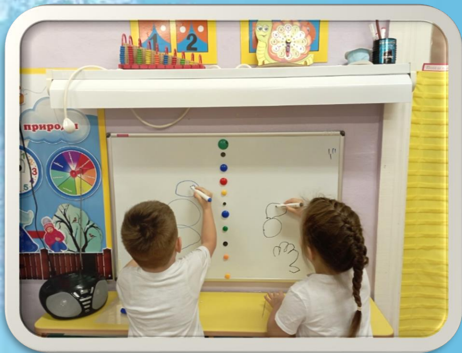
Коммуникативная игра «Снеговик»