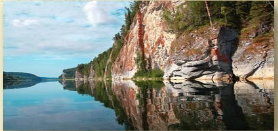
Гора Народная 1895 метров, Уральские горы