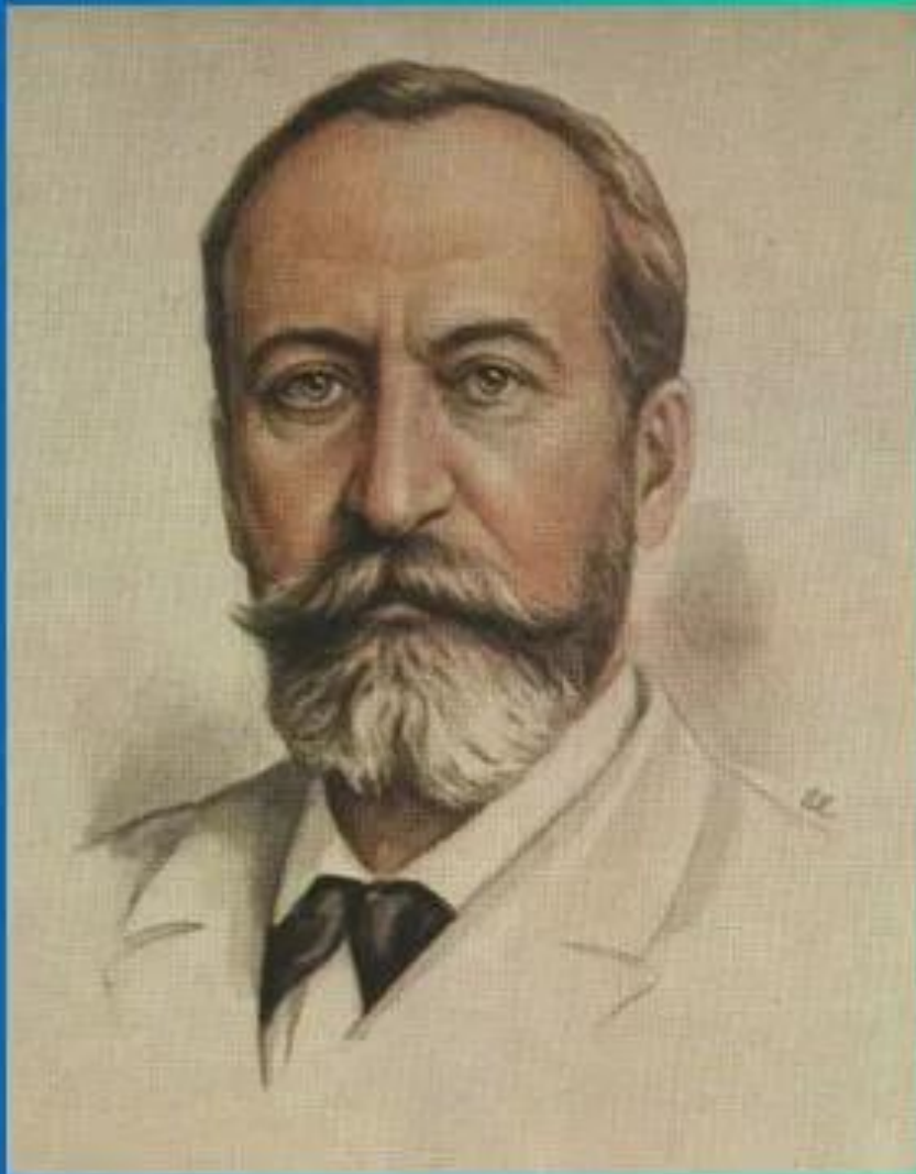
Камиль Сен - Санс